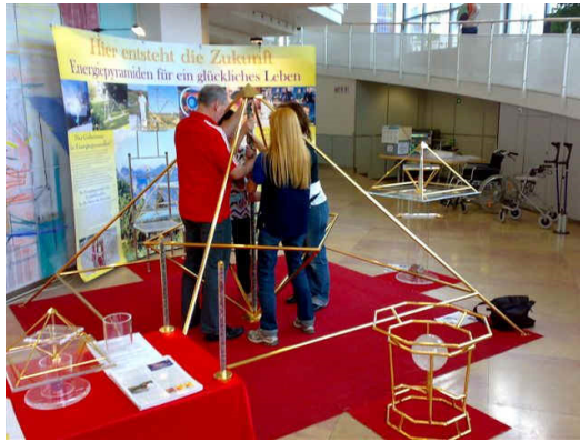
Messe in Cham / Schweiz Sept. 2009