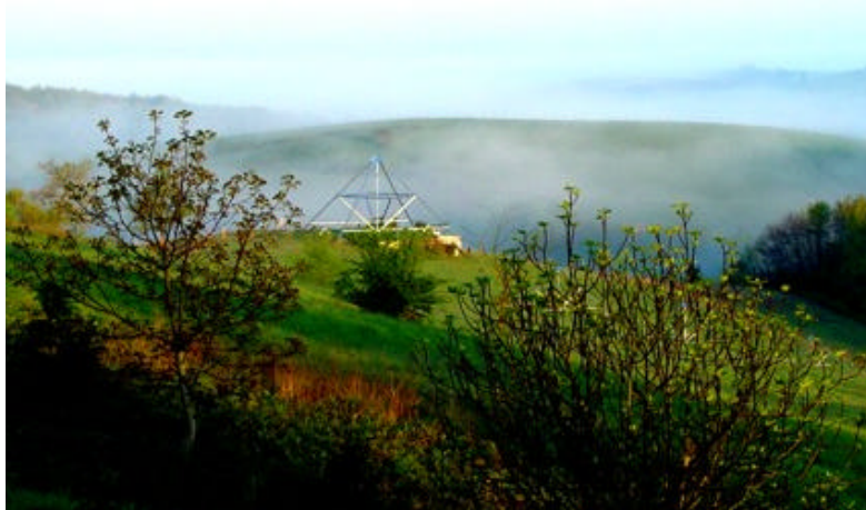
La pyramide de 9 m en Ariège, la plus grande du monde

Grâce aux pyramides énergétiques, vous obtenez une meilleure qualité de vie en débarrassant votre lieu de séjour et de travail de toutes les causes de perturbation telles que zones géopathogènes et veines d'eau, vous vous protégez de l'électrosmog en stabilisant votre système immunitaire et votre résistance. Vous vous détendez et dormez mieux dans des pièces purifiées et débordez d'énergie vitale ou prana.